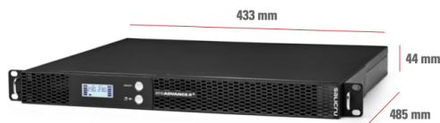
SPS 1000/1500 ADV R